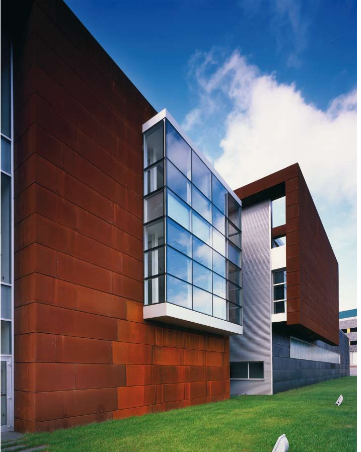
Centre Technologique de l'Acier.