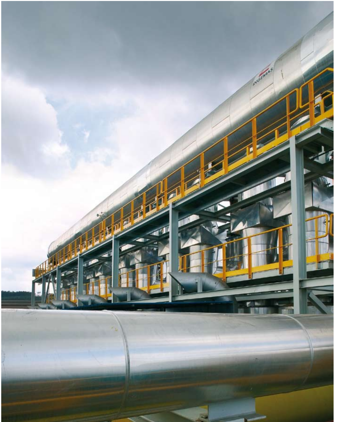
ArcelorMittal: Centrale de cogénération SIDERGAS.