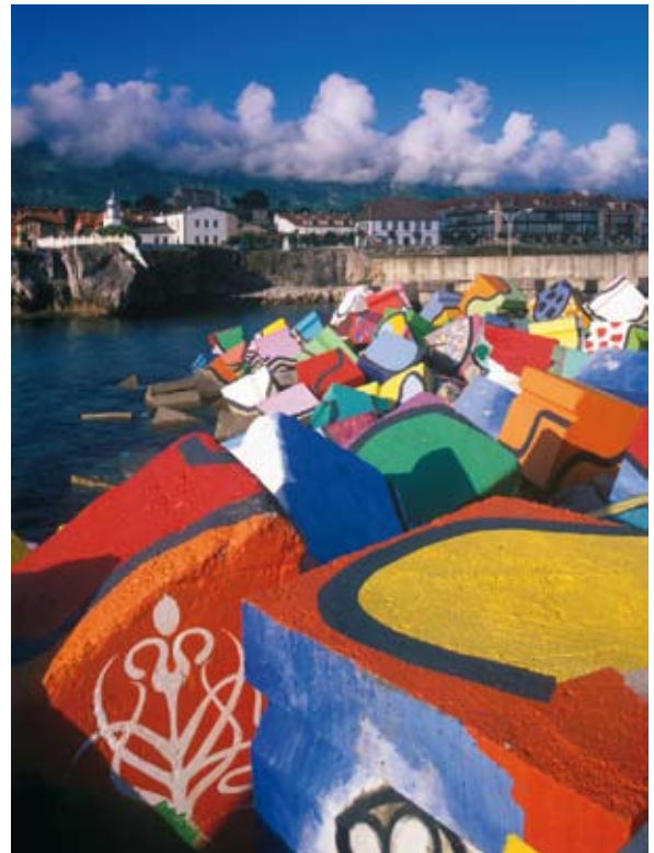
Die Würfel des Gedächtnisses (Llanes) von Agustín Ibarrola.